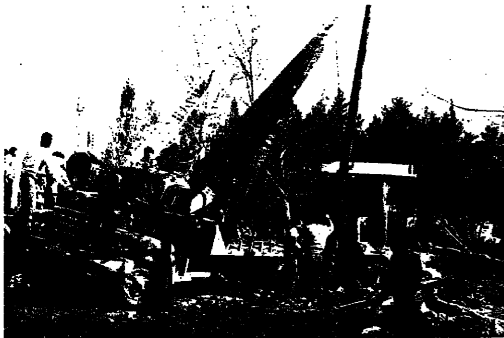
جرافة تزيل الانقاض